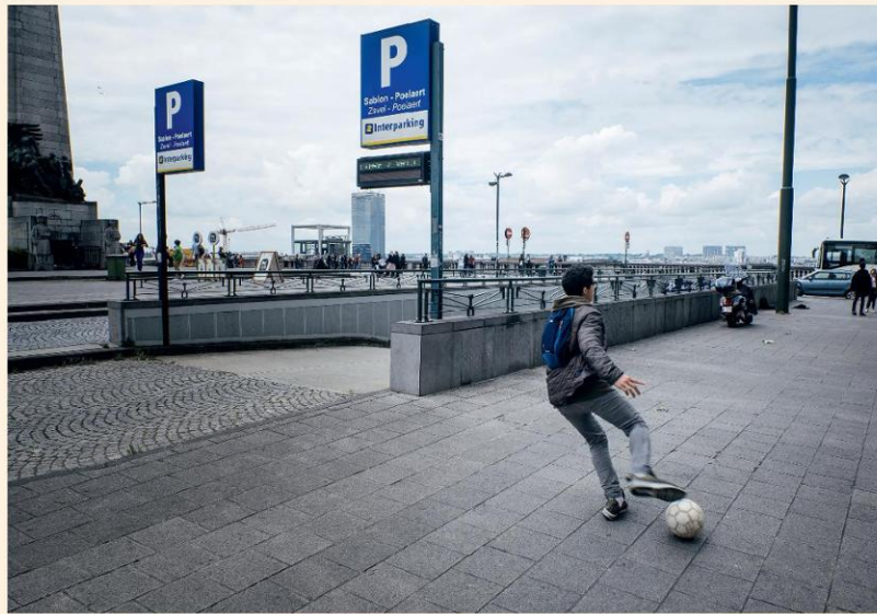
Interparking beheert 1.100 parkeergarages in Europa, zoals onder het Poelaertplein in Brussel.

De nettoschuld van de groep bedroeg eind 2022 774 miljoen euro of 5,4 keer de ebitda. In 2021 was dat 6,5 keer. 86 procent van de financiële schuld is ingedekt tegen renteschommelingen.