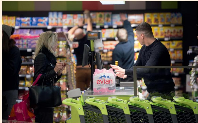
De nieuwe prijzen van Carrefour liggen dichterbij die van Albert Heijn en verder van die van Delhaize.